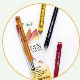
火柴人多功能原子筆 (書寫、觸控、潔屏、電話座)

作為非牟利、非政府資助的志願機構，「突破」的經費一直有賴社會各界人士的慷慨捐獻。今年賣旗日未獲抽籤成功，你的支持更形重要。我們期望是次籌款活動能籌得港幣80萬元，資助青少年事工發展。誠邀你的同行，讓新一代茁壯成長，成為我城的祝福！